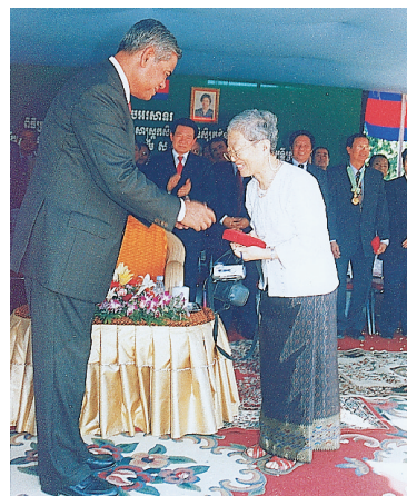
2003年4月3日卒業式で 副首相から勲章を授与される

ウイルスが分かってもワクチンの開発はまだ時間がかかる。今のところは感染者の隔離と検疫という古典的な封じ込め作戦で成功したかに見えるが、冬の感冒多発シーズンにどうか新型肺炎が再び地上に出てこないよう、祈るのみである。（1996～1999東南アジア研究センター教授。現在医仁会武田総合病院院長代理）