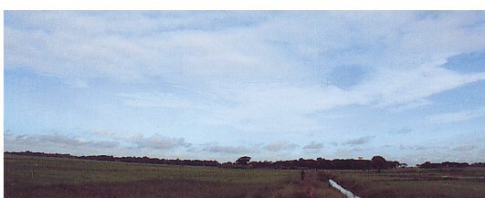
田んぼと屋敷林のモザイク——イラワジデルタ

田んぼと屋敷林のモザイクが、イラワジデルタの景観である。屋敷林には、果樹や竹をはじめとする有用植物が植えられ、ときには畑が作られることもある。このような空間は人間活動の影響の大きな環境なのだが、野生生物の生