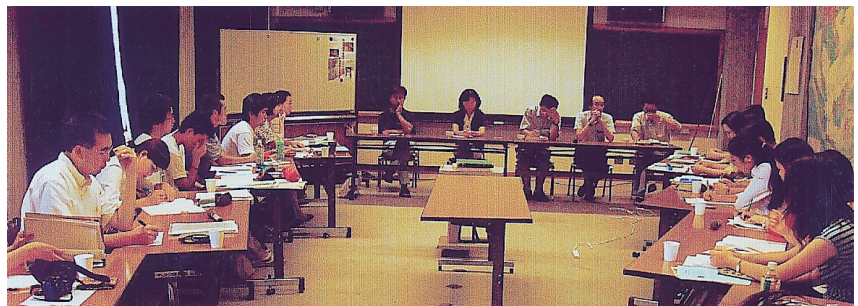
議論は日を追うにつれ白熱した