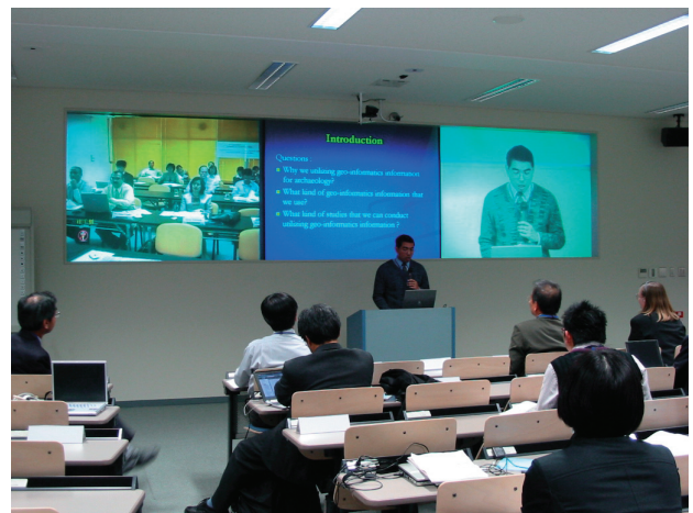
京都大学・アジア工科大学 (タイ) 間で初めての の双方向ビデオ会議が開かれた